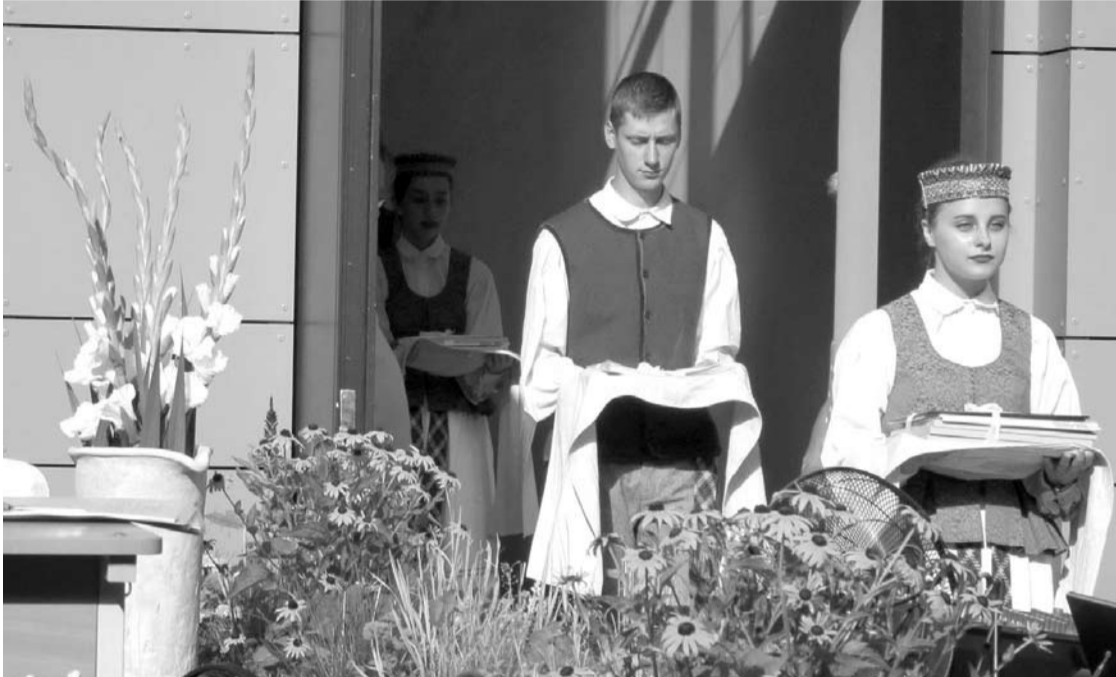
Anykščiuose gyva tradicija abiturientams atestatus įteikti vilkint tautiniais drabužiais.

Apie tai, kaip Anykščių rajono abiturientai švenčia išleistuves, „Anykšta“ kalbėjosi su gimnazijų vadovais, tėvais, mokiniais.